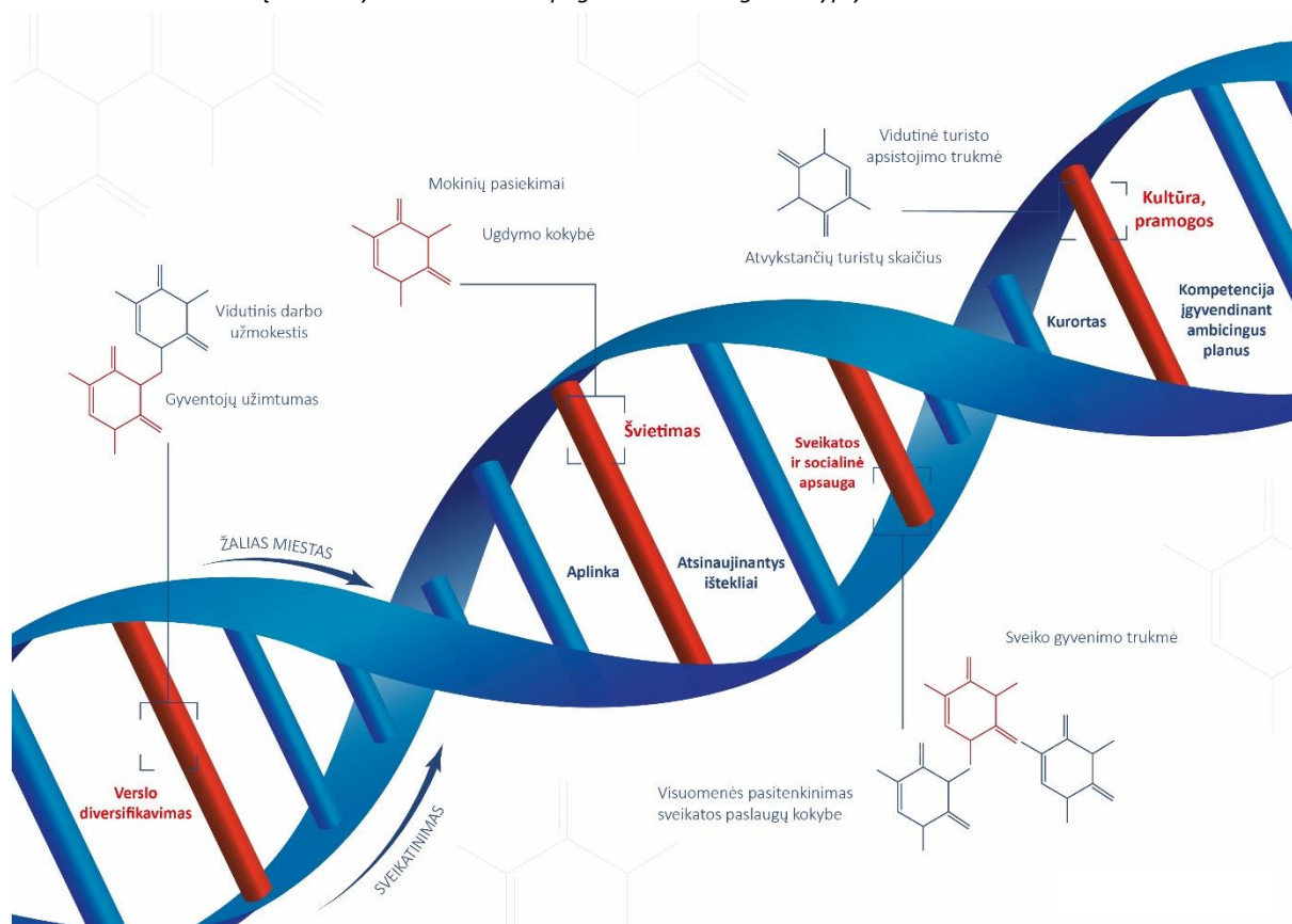
Paveikslas 3. Druskininkų savivaldybės identitetas ir pagrindinės strateginės kryptys

Druskininkų savivaldybės vizijai įgyvendinti yra numatyti 2 pagrindiniai veiklos prioritetai, kuriems yra išskirti ambicingi tikslai: