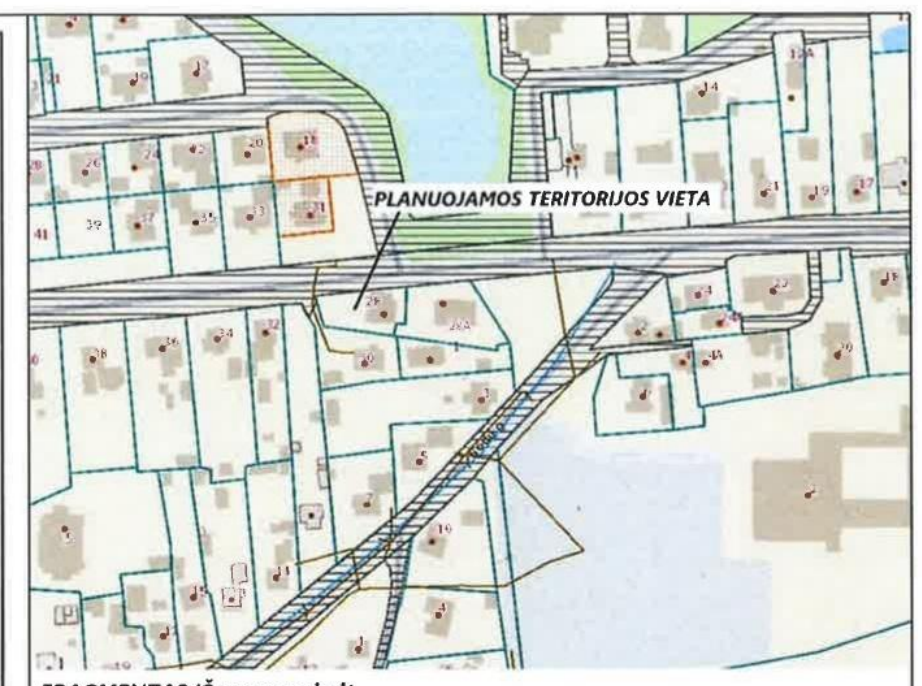
FRAGMENTAS IŠ www.regio.lt