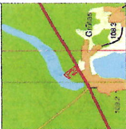
Žemes sklypo išdėstymo schema