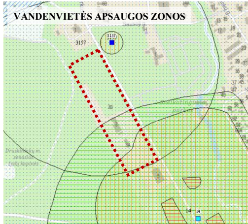
21 pav. Požeminio vandens vandenviečių žemėlapių fragmentas

Žemės gelmių registro duomenimis planuojama teritorija patenka į Druskininkų II požeminio vandens vandenvietės Nr. 14 apsaugos zonos 2, 3A ir 3B juostas ir UAB „Raminora“ vandenvietės Nr. 3157 3B juostą (žr. 21 pav.). Vadovaujantis Lietuvos Respublikos specialiųjų žemės naudojimo sąlygų įstatymu, planuojamai teritorijai galioja VI sk. 11 skirsnio „Požeminio vandens vandenviečių apsaugos zonos“ reikalavimai.