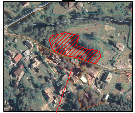
Objekto vieta. Schema