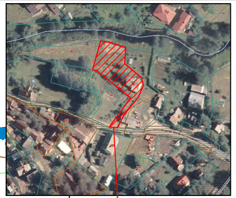
Objekto vieta. Schema

Projektuojami ilgiai -F1- PVC DN 110: 2,40 PVC DN 160: 4,20 -FS1- PE DN 63: 52,30