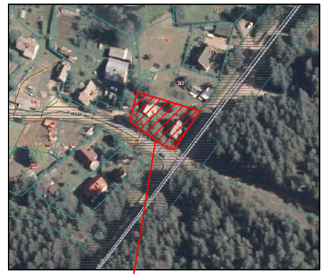
Objekto vieta. Schema

Projektuojami ilgiai -FS1- PE DN 63: 34,00