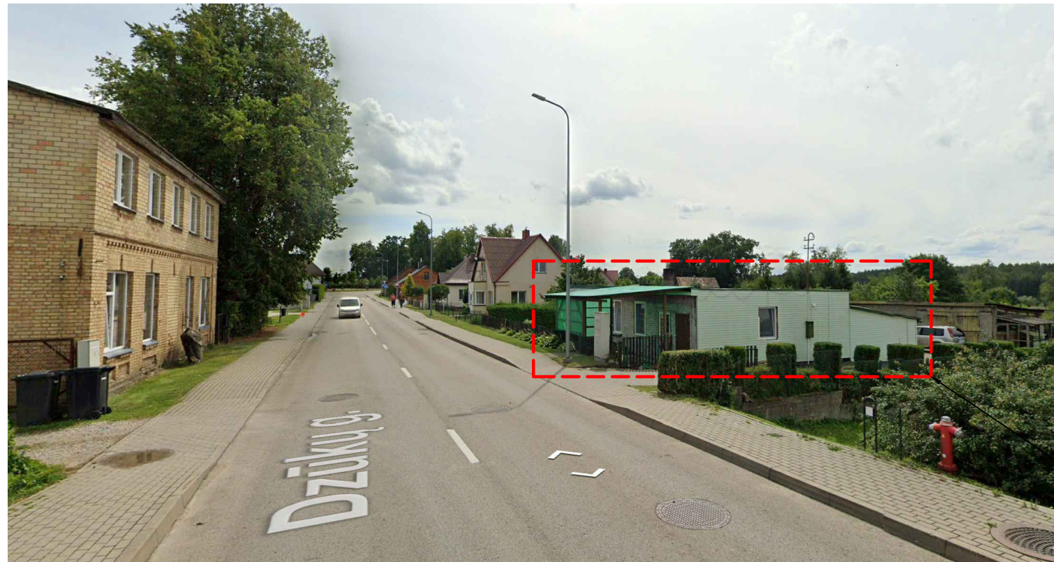
Nagrinėjamas pastatas Dzūkų g. 10, Leipalingis