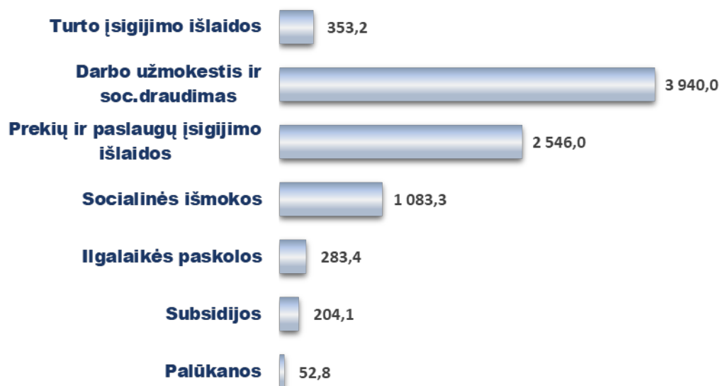
2 diagrama. 2023 metų biudžeto asignavimų pagal programas įvykdymas, tūkst. eurų

2024 metų I ketvirčio įvykdytų asignavimų 46,6% arba 3 940,0 tūkst. eurų sudarė darbo užmokesčio ir socialinio draudimo įmokų išlaidos, 30,1% arba 2 546,0 tūkst. eurų sudarė prekių ir paslaugų įsigijimo išlaidos, 12,8% arba 1 083,3 tūkst. eurų sudarė socialinių išmokų išlaidos, likusią dalį – 10,5 % arba 893,7 tūkst. eurų sudarė palūkanų ir ilgalaikių paskolų grąžinimo, subsidijų ir turto įsigijimo lėšos.