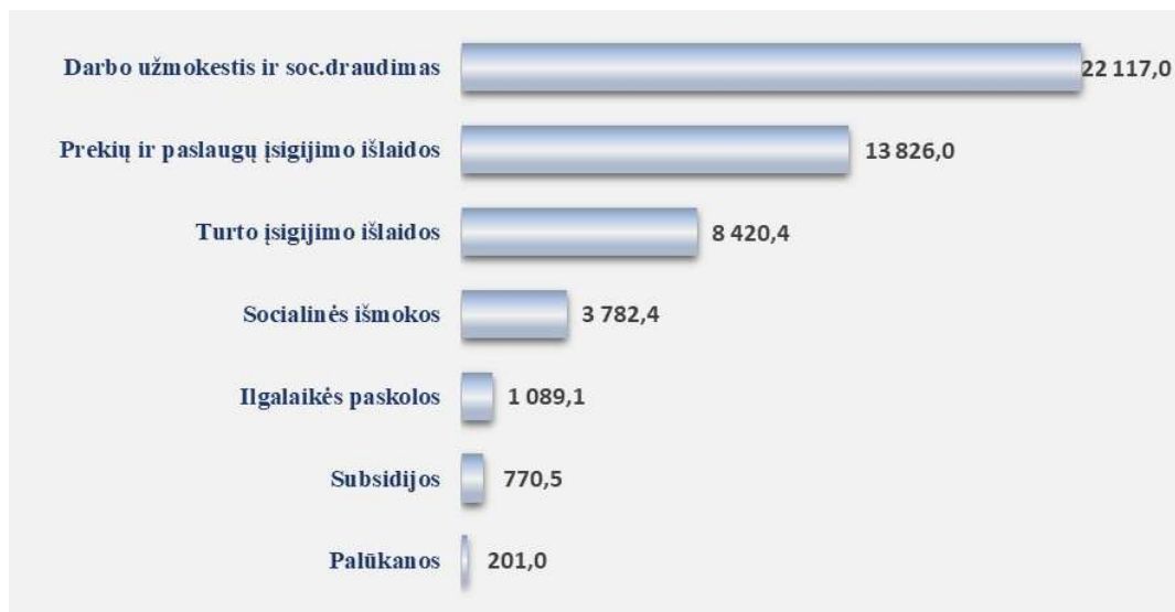
3 diagrama. 2024 metų asignavimų pagal ekonominę klasifikaciją įvykdymas, tūkst. eurų